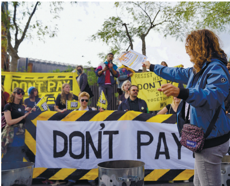
הפגנה בלונדון במחאה על עליית מחירי האנרגיה, באוקטובר.

פטריק אודייר: "המלחמה באוקראינה הראתה כמה מהר מדינות האיחוד יכולות לשנות את רכישת האנרגיה שלהן. זה יאיץ את ההשקעה בתשתיות מתחדשות"